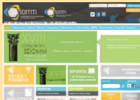
Pantalla de inicio de la página web de la SEIOMM.